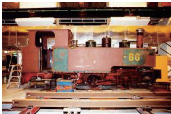
於九廣鐵路公司何東樓車廠進行復修工程

九廣鐵路公司及博物館員工，經過多番努力，這兩部闊別香港幾近七十年的蒸汽火車頭，終於在一九九五年運返本港，其中一部經修復原貌，於香港鐵路博物館內展出。