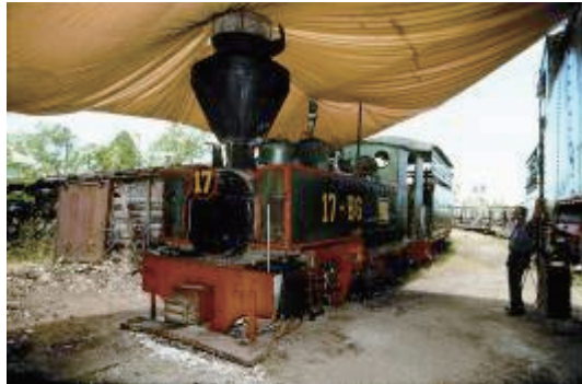
已被菲律賓蔗園棄用的0-4-4T 蒸汽火車頭

兩部機車分別於一九二八年及三零年運抵菲律賓，售予經營蔗園的Victorias Milling Co. Inc.，並一直使用至一九九零年代初期。