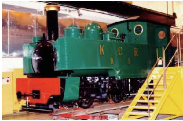
已復修的蒸汽火車頭