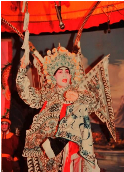
《英雄兒女保江山》舞台劇照