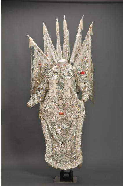
白地銀片大靠連帥旗 《六國大封相》戲服 1960年代 2010.10.203