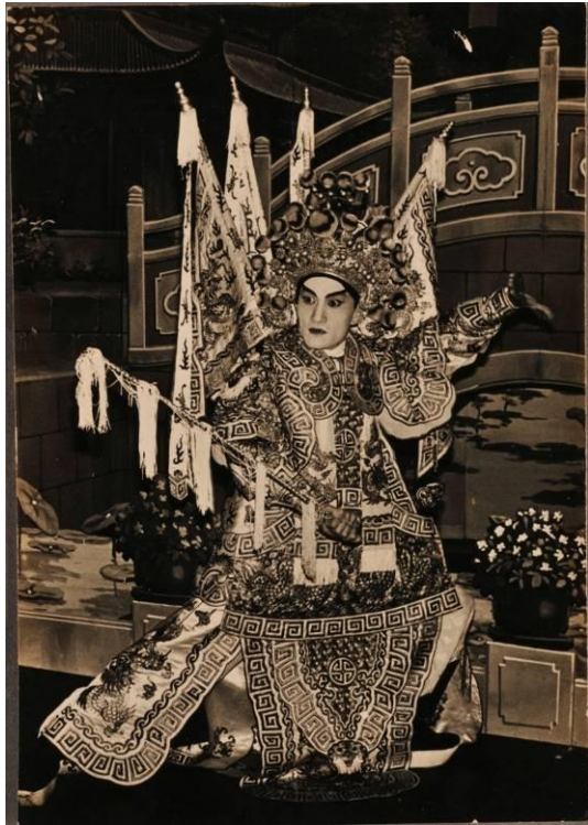
《一把存忠劍》舞台劇照