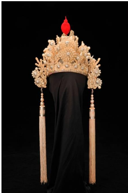
尼龍托鑲石帥盔 1960年代 2010.10.310