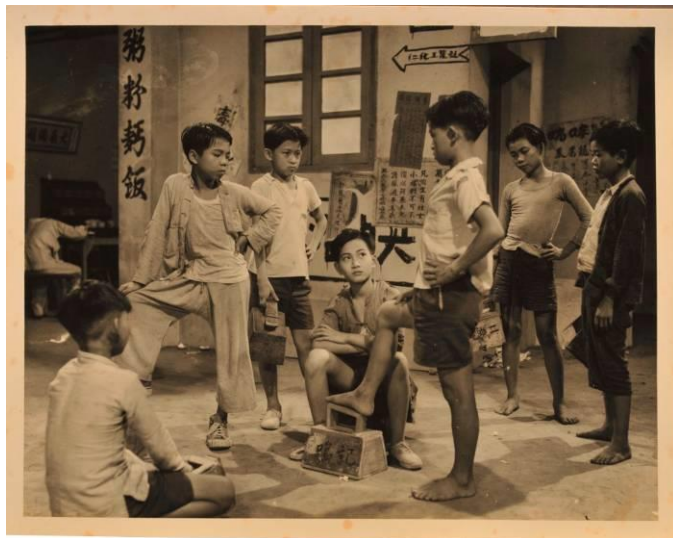
《劫後孤兒》電影劇照 1950 年 2010.16.724